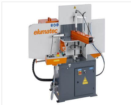
Frezarka do słupków AF 223/01