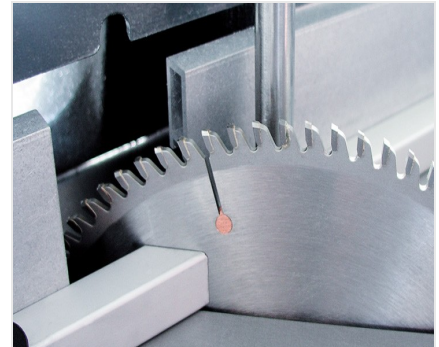
Tafelzaag TS 161/21