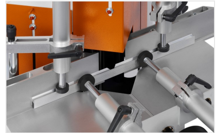
V-zaagmachine KS 101/30