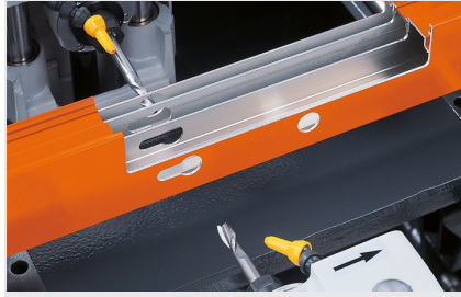
Driespindel- kopieerfreesmachine KF 178/10