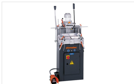
Éénspindel- kopieerfreesmachine AS 70/44