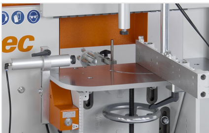
UithoekfreemACHINE AF 223/01