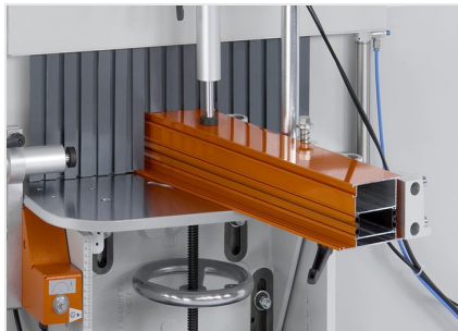
Uithoekfreesmachine AF 223/01