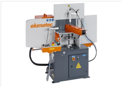
Uithoekfreesmachine AF 223/01