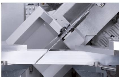
Centro di lavoro SBZ 631