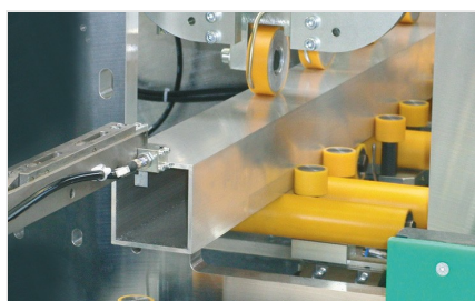
Centro di lavoro SBZ 631