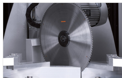
Centro di lavoro SBZ 631