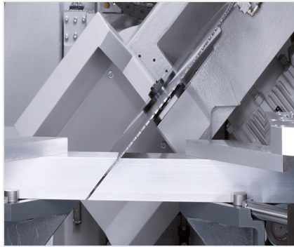
Centro di lavoro SBZ 630