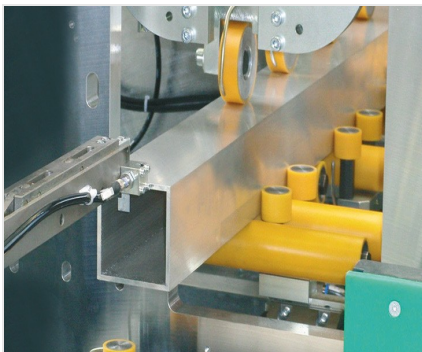
Centro di lavoro SBZ 630