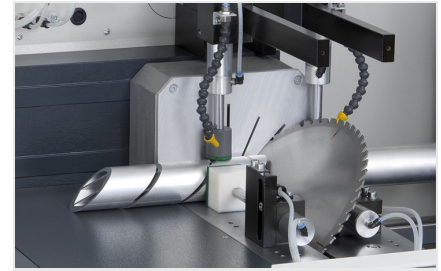
Troncatrice automatica SAS 142/43