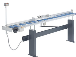
Sistema di battuta e misurazione MMS 200