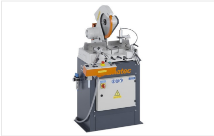
Troncatrice per tagli obliqui MGS 73/33