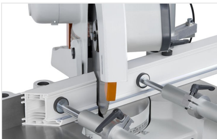
Troncatrice per tagli obliqui MGS 73/33