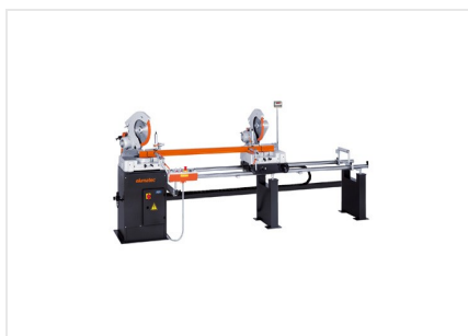
Troncatrice bilama DG 79