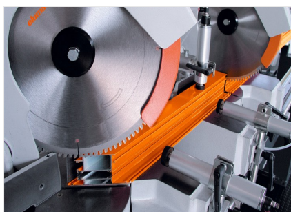
Troncatrice bilama DG 79