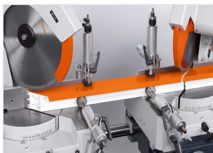
Troncatrice bilama DG 79