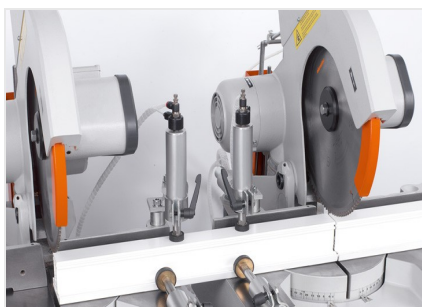
Troncatrice bilama DG 79