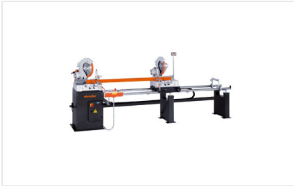
Troncatrice bilama DG 79