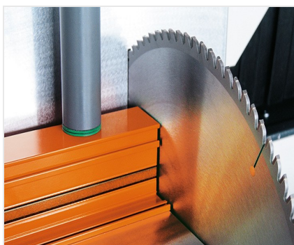
Troncatrice bilama DG 104