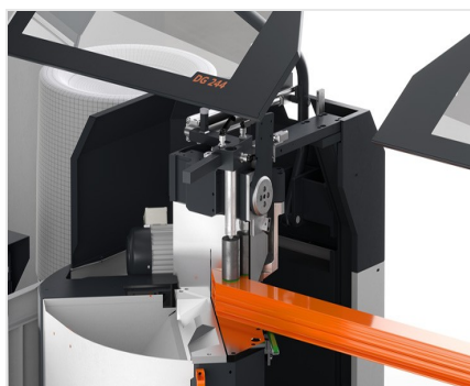
Troncatrice bilama DG 104