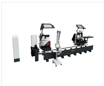
Troncatrice bilama DG 104 + E 590