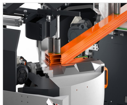
Troncatrice bilama DG 104