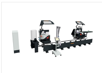
Troncatrice bilama DG 104 + E 590