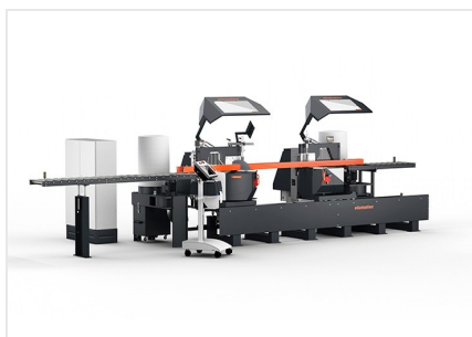
Troncatrice bilama DG 104