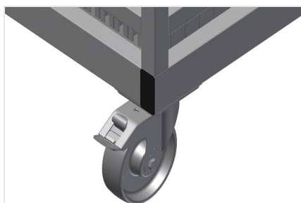
Ruote orientabili compl.

20 scomparti, dimensione scomparto 200 x 200 mm