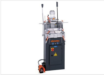
Pantografo a mandrino singolo AS 70/44