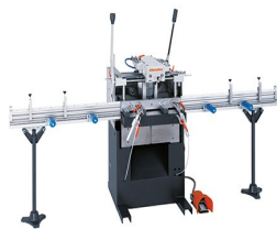
Pantografo a mandrino singolo AS 170/10