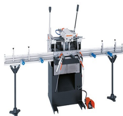
Pantografo a mandrino singolo AS 170/10