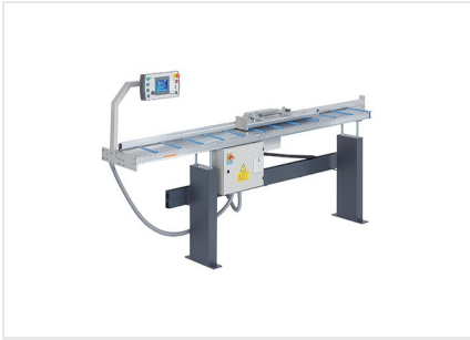
Sistema di battuta e misurazione AMS 200 + E 355