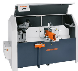
Troncatrice intestatrice AKS 134/64