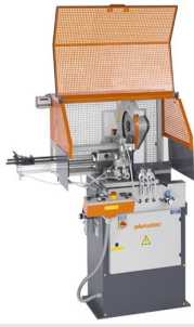
Scie automatique SA 73/36