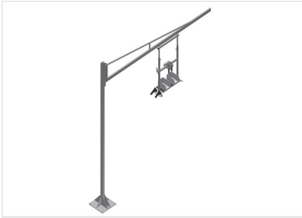
Support d'appareil G 3000 + colonne en acier S 3000