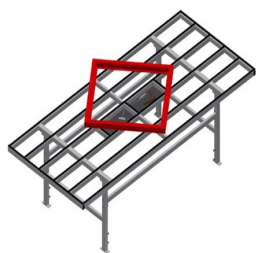
Table de déplacement MST 3000