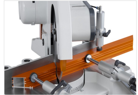
Scie à onglets MGS 73/33