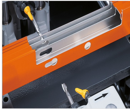
Fraiseuse à copier double- broches KF 78/23