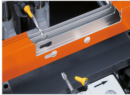
Fraiseuse à copier double- broches KF 78/23