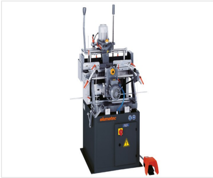
Fraiseuse à copier double- broches KF 78/23