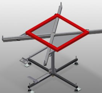
Table tournante pour tous les travaux sur le cadre et le vantail