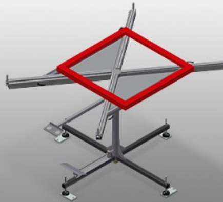
Table tournante pour tous les travaux sur le cadre et le vantail. Construction en acier stable. Table de travail pivotante. Utilisation universelle de la table de travail pour les travaux de montage, comme table de travail pour la mise en place des joints, pour le post-usinage dans la fabrication spéciale, dans le montage de ferrures et dans le montage final. 4 bras supports extensibles progressivement. Bras supports recouverts de caoutchouc. Surface de table pivotante à 360° avec immobilisation à l'aide d'une pédale. Avec tablette de rangement et emplacement de rangements d'outils pratique. •