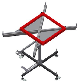
Table tournante DT 1000