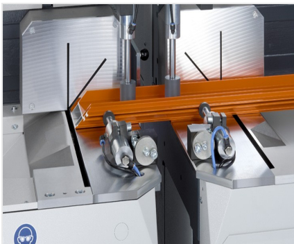
05. Double scie à onglets DG 142 XL