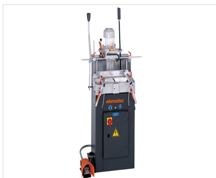
Fraiseuse à copier mono- broche AS 70/44