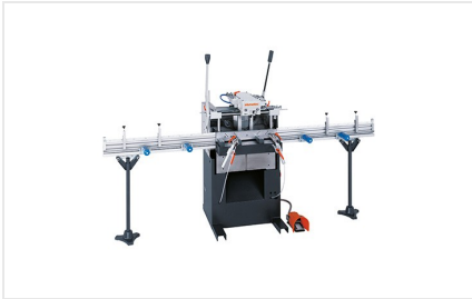
Fraiseuse à copier mono- broche AS 170/10