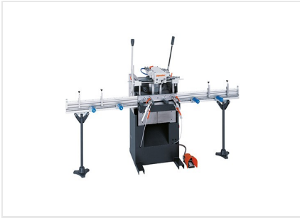
Fraiseuse à copier mono- broche AS 170/10