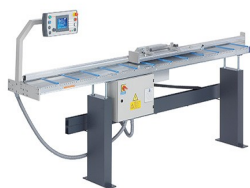
Système de butée et de mesure AMS 200 + E 355