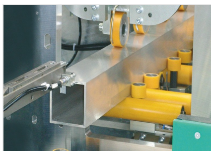
Centro de mecanizado de barras SBZ 631