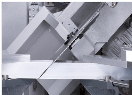
Centro de mecanizado de barras SBZ 631