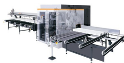
Centro de mecanizado de barras SBZ 631