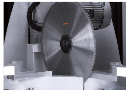
Centro de mecanizado de barras SBZ 631