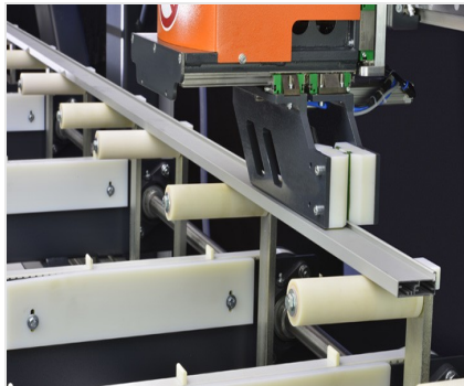
Banco de corte a medida SBZ 616/02