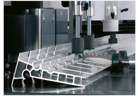
Tronzadora automática SAS 142/44