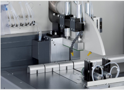
Tronzadora automática SAS 142/44