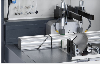
Tronzadora automática SAS 142/43