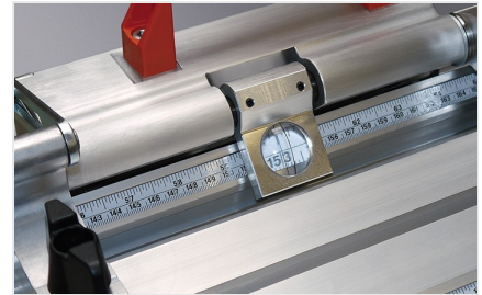
Sistema de tope y medición MMS 200