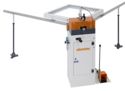
Ensambladora de esquinas EP 120