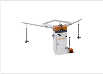
Ensambladora de esquinas EP 120