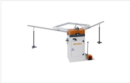
Ensambladora de esquinas EP 120