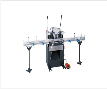
Copiadora fresadora simple AS 170/10