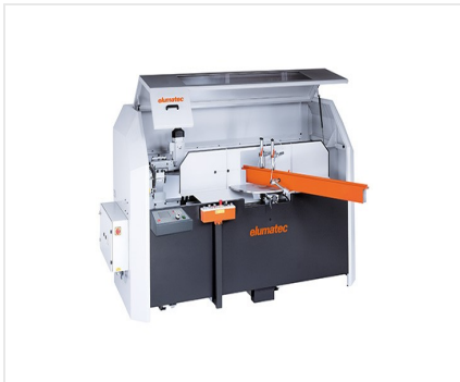
Tronzadora retestadora AKS 134/00