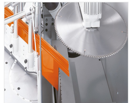
Tronzadora retestadora AKS 134/00