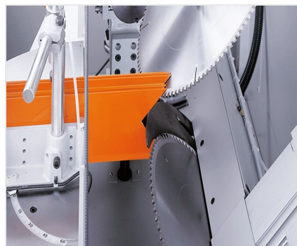
Tronzadora retestadora AKS 134/00