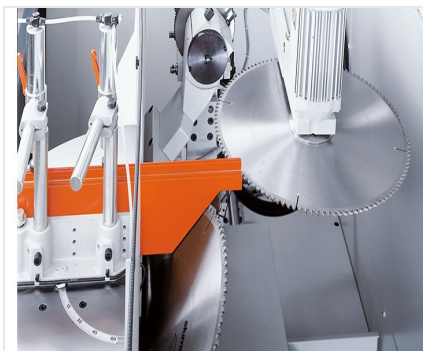
Tronzadora retestadora AKS 134/00