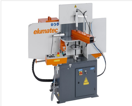
Fresadora retestadora AF 223/01