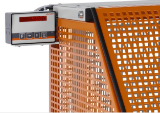
Sägeautomat SA 73/36