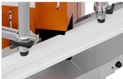
Keil- und Klinkschnittsäge KS 101/30