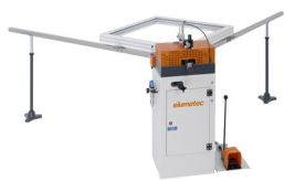
Eckverbindungspressen EP 120