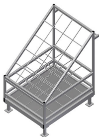
Armierungswagen AW 1100