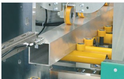
Centrum pro obrábění tyčí SBZ 631