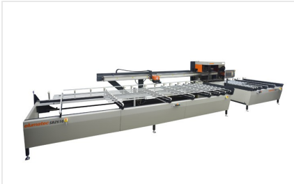
Nářezové centrum SBZ 616/02