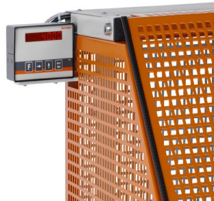
Pilový automat SA 73/36