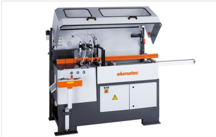
Pilový automat SA 142/37