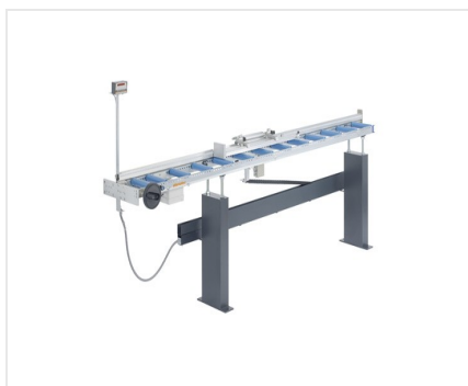
Dorazový a měřicí systém MMS 200