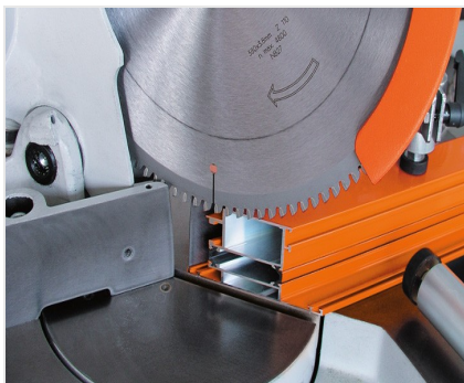
Pokosová pila MGS 73/33