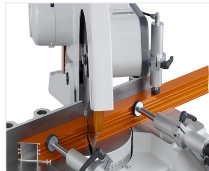
Pokosová pila MGS 73/33