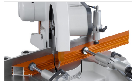
Pokosová pila MGS 73/33