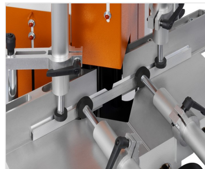
Klíňová a vyřezávací pila KS 101/30