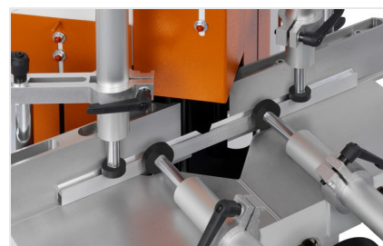
Klíňová a vyřezávací pila KS 101/30