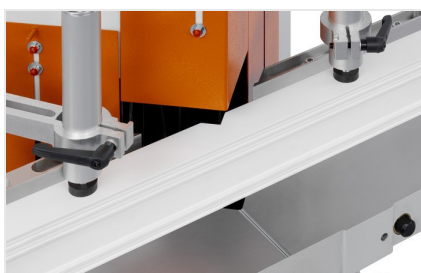
Klíňová a vyřezávací pila KS 101/30