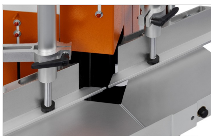
Klíňová a vyřezávací pila KS 101/30